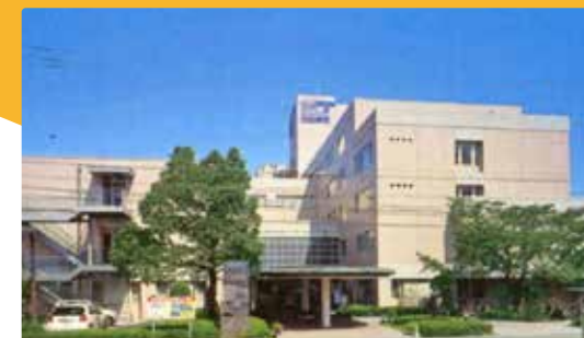
総合病院 鹿児島生協病院 臨床研修指定病院

鹿児島生協病院は、1975年に市民病院として誕生しました。1989年に鹿児島市の民間病院で初めての総合病院となり、鹿児島南部の中核的な病院として大きな役割を果たしています。2009年にはベッド数が306床となり、救急医療や重症患者の受け入れなど地域に根ざした医療を展開するとともに、次世代を支える医療従事者の育成をすすめています。