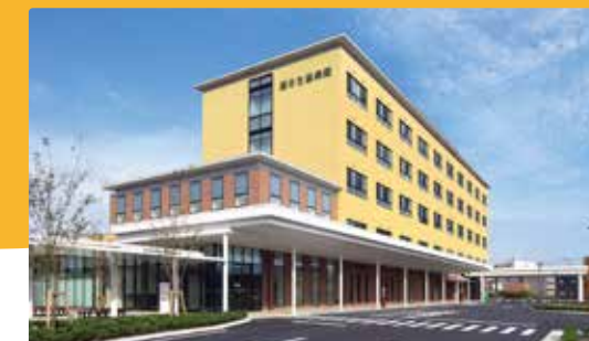
国分生協病院 日本医療機能評価機構認定病院

〒891-0141 鹿児島市谷山中央5丁目20-10 TEL.099-267-1455 http://www.kaseikyohp.jp/