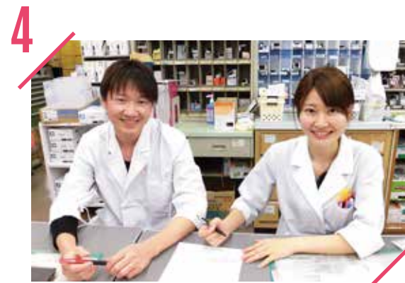
4 充実した職場教育

さまざまな症例を経験し、多くの分野の知識が得られます。また、業務はローテーションで行っているため、オールマイティーにスキルを習得できます。