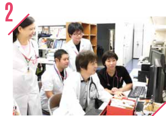
2 チーム医療への参画

ライフスタイルを尊重し、急性期から回復期まで一貫した関わりを大切にしています。また、一緒に考えることは私たちの学びにもつながっています。