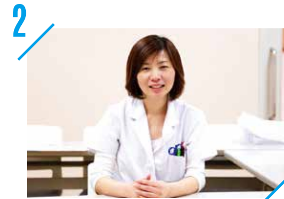
2 女性薬局長ならではの考え方

みんなで話す機会を作り、いろいろなアイデアを出し合い、情報共有することで、より安全な薬物療法を目指します。