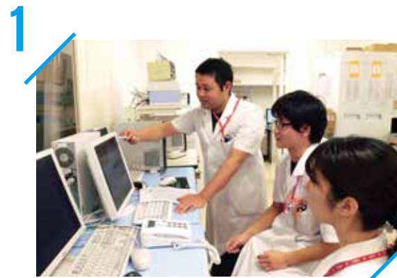
1 話しかけやすい環境

みんなで話す機会を作り、いろいろなアイデアを出し合い、情報共有することで、より安全な薬物療法を目指します。