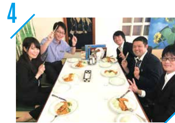
4 プライベートも充実

目指す目標に向けて、3ヶ月ごとの評価・課題を明確化し、それぞれの力を最大限に発揮できるように業務分担を行っています。