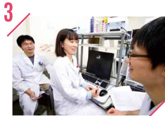
3 さまざまな症例への関わり

カンファレンスや院内学習会では医師、看護師をはじめ他職種の専門的な視点で行うディスカッションを通して総合的に考える力が身に付きます。