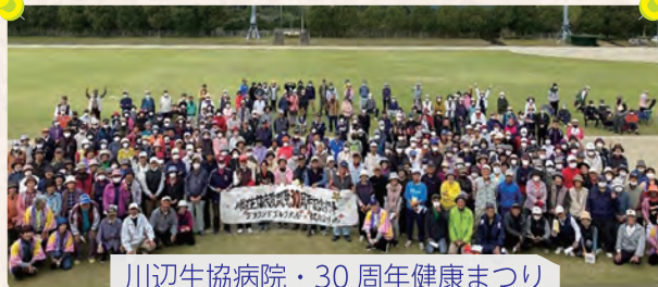
川辺生協病院・30周年健康まつり