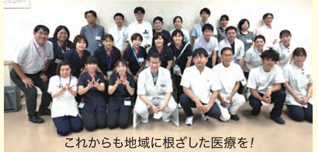
これからも地域に根ざした医療を！

歯科は昨年、歯科衛生士を新たに採用し、充実した歯科医療を提供しています。基本予約制ではありますが急患、夜間診療、往診も行っています。是非ご相談ください。