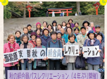
秋の組合員バスレクリエーション(4年ぶり開催)