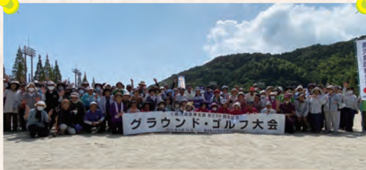
50周年グラウンド・ゴルフ大会