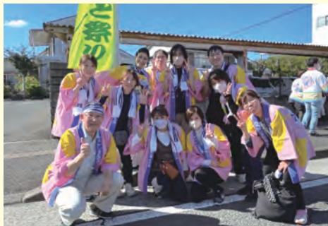
谷山ふるさと祭りに参加しました

●お問い合わせ先● TEL.099-210-2211 (谷山生協クリニック) TEL.099-267-6480 (歯科)