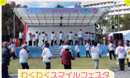
わくわくスマイルフェスタ