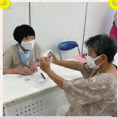
まちかど健康チェック再開