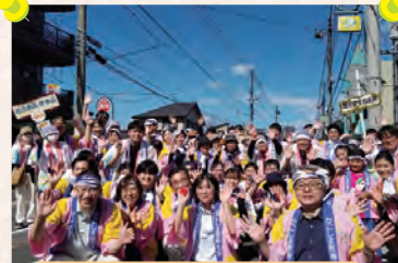
谷山ふるさとまつり