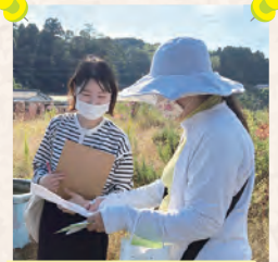
地域訪問行動(谷山南部ブロック)