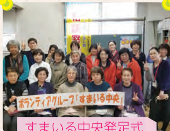
すまいる中央発足式