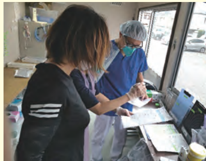
発熱者外来の様子