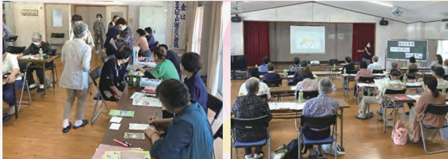
安心して暮らせるまちをめざして