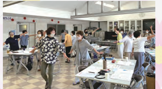
動いて笑って楽しい！