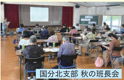
国分北支部 秋の班長会