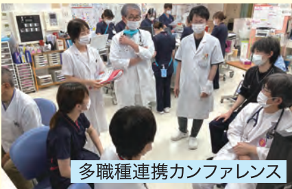
多職種連携カンファレンス

また、霧島市の救急医療において中心的な役割を担っており、年間で1,000台以上の救急車の受け入れを行っています。近隣の開業医の先生方からも多くのご紹介をいただくなど、地域の皆様から頼っていただける病院となっています。