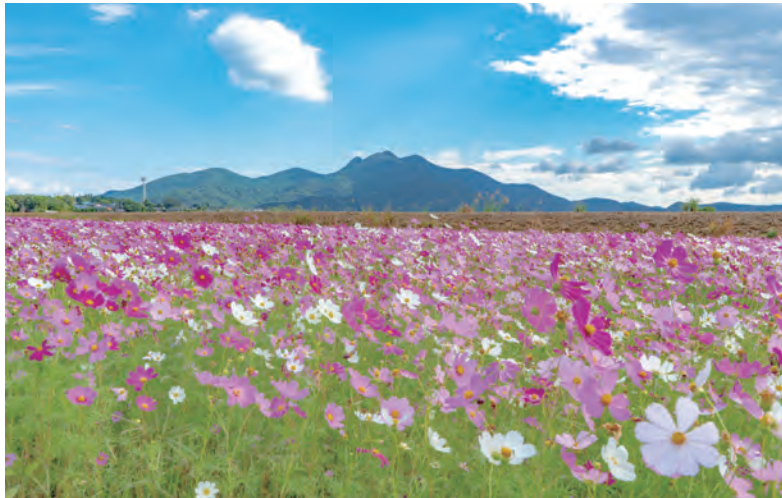
コスモス畑 (南さつま市金峰町)

2023年10月号 鹿児島医療生活協同組合 鹿児島市谷山中央5丁目12番3号 電話 (099) 268-8955 FAX (099) 269-7199 編集 機関紙編集委員会 発行責任者 専務理事 福峯清