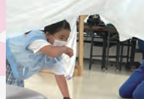
煙を吸わないように！