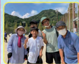
家族で応援に 来ました!