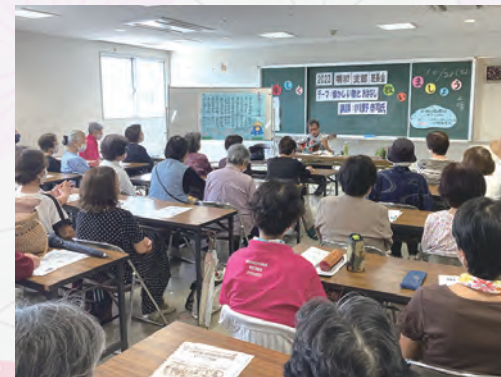
忘れがたき ふるさと〜♪