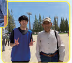
職員も組合員さんと 交流できました