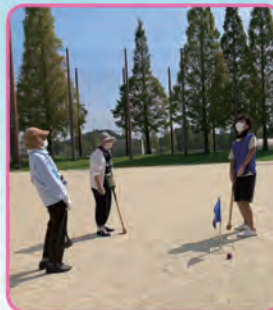
あと少しで入ったのに~