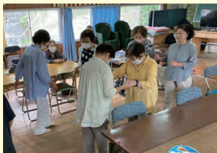
ジルバのリズムで♪

た、メンバーの方が社交ダンスをされていたことが分かり、簡単なステップを教えてもらいその場で即興のジルバを皆年齢も高齢になってきていますが、メンバー皆でできること、楽しめることを続けていきたいと思っています。新しいメンバーも募集中です。興味のある方はどうぞお気軽にお問い合わせください