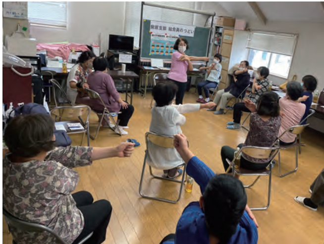
ひさしぶりに皆に会えました！（班長会）

お友達やご近所さんと班をつくり、班会で楽しく交流しながら健康に関することやくらしに関することなどを学んでみませんか？ 班づくりや班会内容などお尋ねしたいことがございましたら、お気軽に本部健康まちづくり部や運営委員、最寄りの事業所窓口にお尋ねください。班づくりから班会開催まで、一緒にお手伝いいたします。