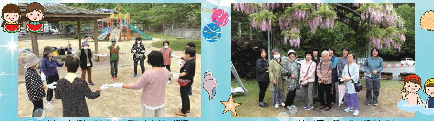
「あんたがたどこさ」の歌にあわせて棒渡し 美しい藤の花の前で記念撮影 枕崎弁での体操、笑って楽しく!!