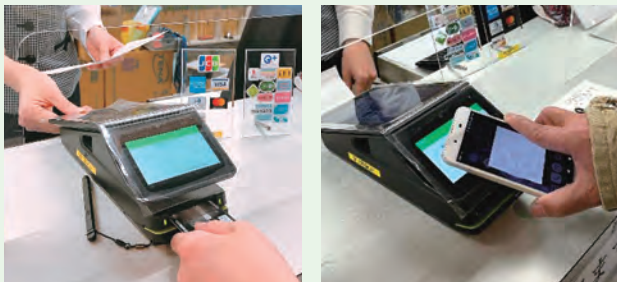
クレジットカードやスマートフォンでの決済にも対応しています

クレジットカードやQRコード決済など、支払い方法の選択肢が広がり、患者サービスの向上につながります。非接触でのお会計が可能となり、感染防止策としても有効です。