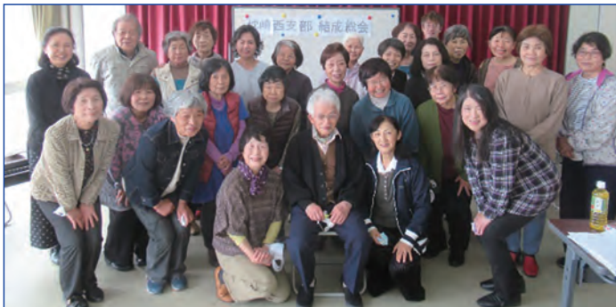
新支部結成 (枕崎西支部)