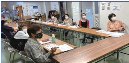
組合員活動交流会