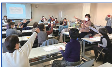
脳いきいき班会 インストラクター交流会