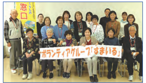
ボランティアグループ「すまいる」発足