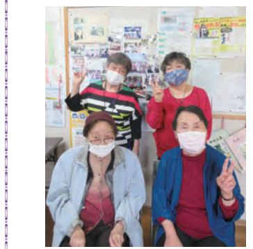
現在の運営メンバー4名です

は3名になってしまいましたが、地域の多くの方々の憩いの場として受け継がれ、今でも和気藹々、楽しく活動を続けています。参加者の皆さんが楽しみにされているのは、ずっと