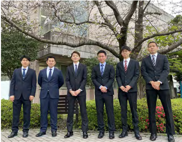
6名の新人医師を迎えました

鹿児島医療生活協同組合 鹿児島市谷山中央5丁目12番3号 電話 (099) 268-8955 FAX (099) 269-7199 編集 機関紙編集委員会 発行責任者 専務理事 福 峯 清 行