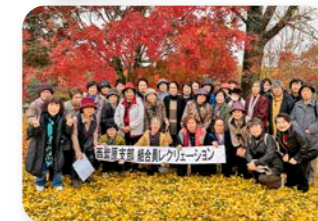
組合員レクリエーション