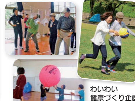
わいわい健康づくり企画