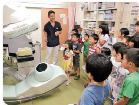
からだのしくみ探検隊

組合員の健康づくりのために学習会を企画したり、班での健康チェック、まちかど健康チェックなどで、地域まるごと健康づくりに取り組んでいます。血圧測定や尿チェックなど自分で測定できるように「保健学校」の開校や、「すこしお生活(少しの塩ですこやかな生活)」をすすめています。からだのしくみ探検隊(こども保健学校)など、こどもたちの健康づくりにも力を入れています。